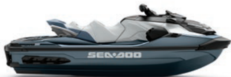
● NOWOŚĆ Blue Abyss