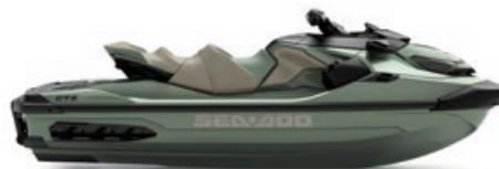
● Premium Metallic Sage